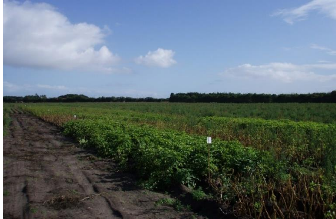
Billede taget den 9/8 ved 1. bedømmelse af nedvisning

I løbet af sommeren har vi taget et par billeder af forsøget.